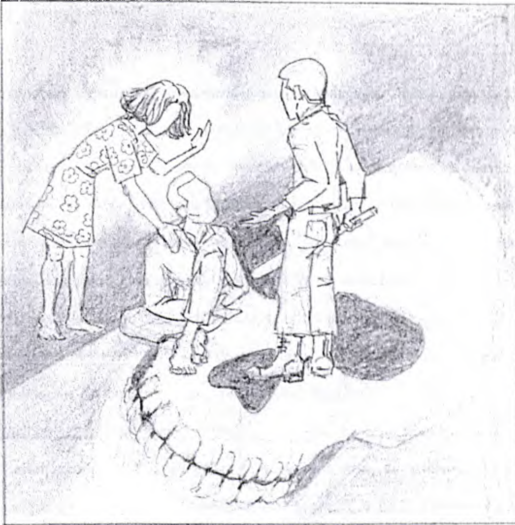
FIGURA 10 – leitura da cena final: a discussão entre Emilio e Miguel (ilustração de Toninho)

tela de arame, que divide os dois espaços, é suspensa por cabos e um foco de luz azul cai no centro do palco, onde se dá a cena da morte.