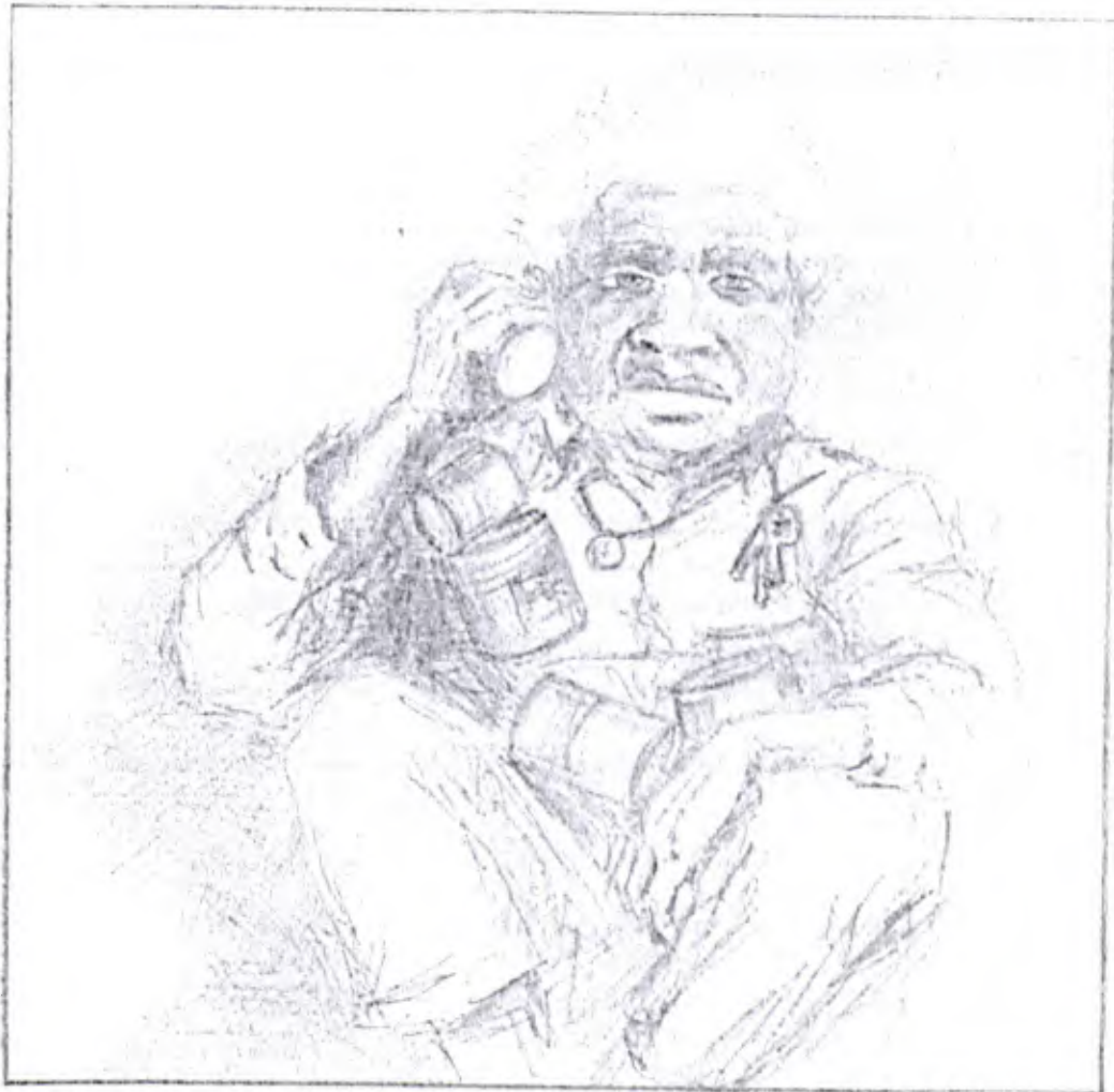
FIGURA 9 – Aurelio (ilustração de Toninho)

Aurelio surge da noite. É um ser estranho. Os farrapos que veste não podem ser classificados; na verdade não são farrapos, há uma sutil diferença entre o que gasta o tempo e o que destrói o tocar, o uso cotidiano: sua roupa está gasta pelo tempo. Latas vazias estão dependuradas, não muitas, sobre o corpo. ((RADRIGÁN apud ALEXANDRE et al., s.d., p. 88)