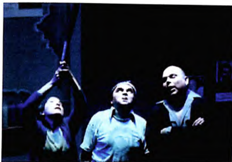
FIGURA 8 – Montagem norte-americana de Hechos Consumados ( When all is Said and done ), dirigida por Martín Balmaceda